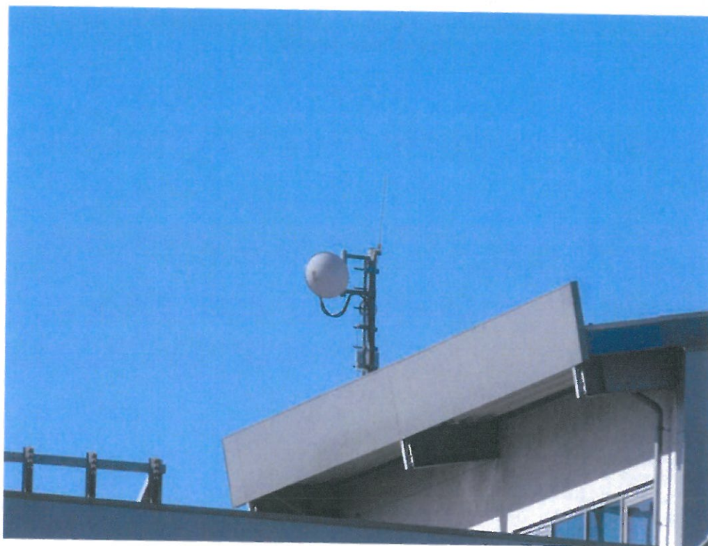
Widok instalacji radiokomunikacyjnej Stacja Netia TAPKB002 - TAPKM00004 Pyrzowice, ul. Wolności 90.