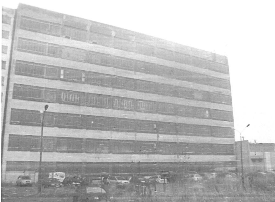
Zof. nr 1: Widok ogólny instalacji radiokomunikacyjnej.